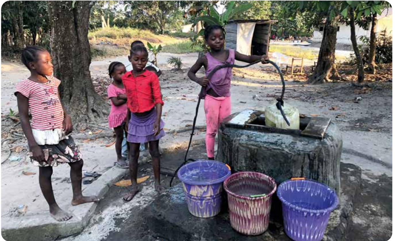
Дівчатка біля типового колодзя

овочі, але цього вистачає лише на часткове покриття власних потреб.