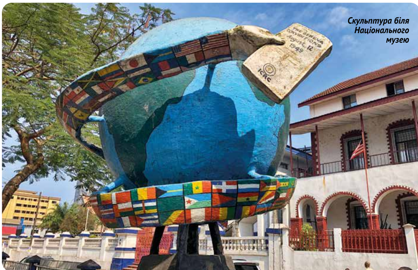
Скульптура біля Національного музею