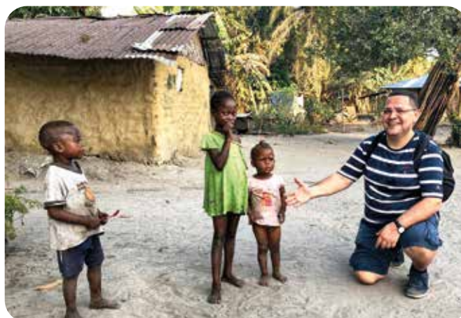
Автор з ліберійськими дітьми

Каучук добувають, як і сотню років тому, просто надрізаючи кору й по краплі збираючи смолу. Оптові компанії купують сировину за копійки, знаючи, що місцевим подітисся нікуди, і це для них єдине джерело існування. Крім каучуку, люди розводять курей і вирощують деякі