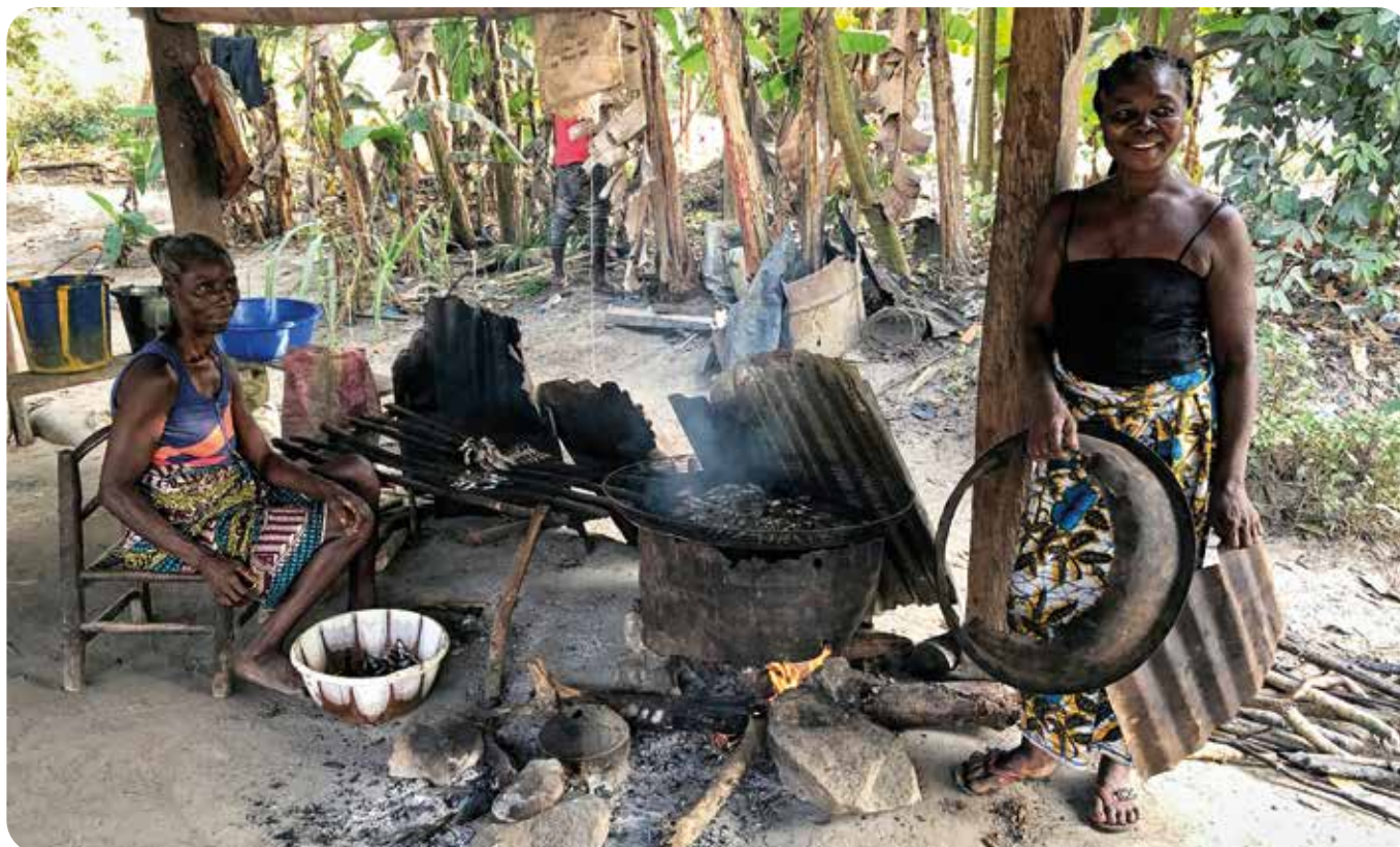
Жінки смажать рибу