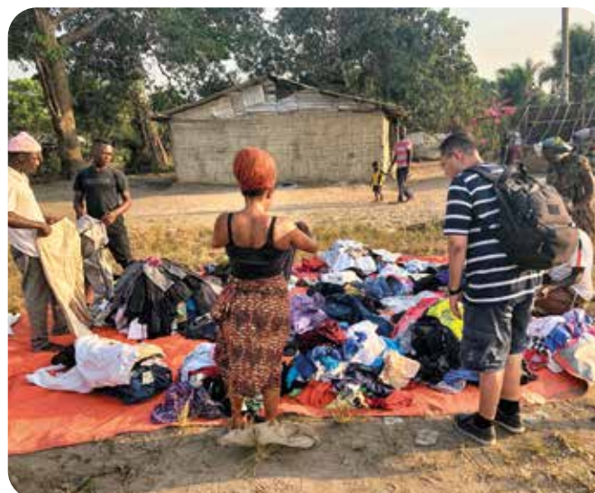
Ринок секонд-хенду у центрі села

Сама по собі Монровія майже нічим не відрізняється від інших столиць у найбідніших країнах Африки. Такий самий бруд на вулицях, така ж хаотична забудова. Вулична торгівля займає все вільне місце на тротуарах. Жовті китайські тук-туки – замість таксі.