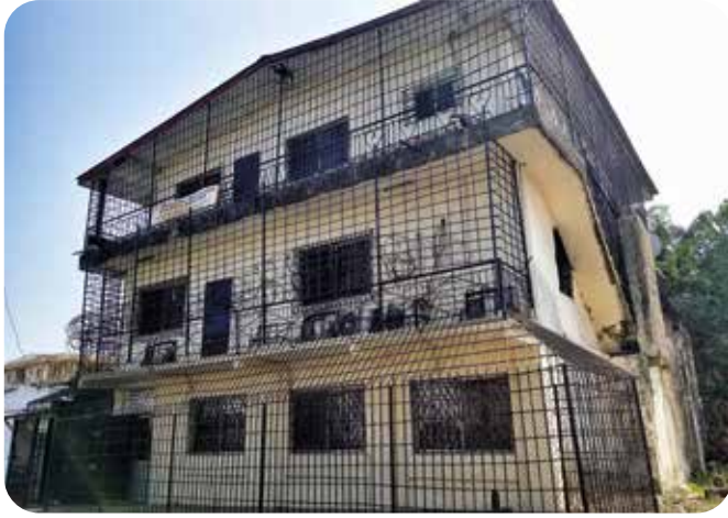
Будинок захищений від злочинців