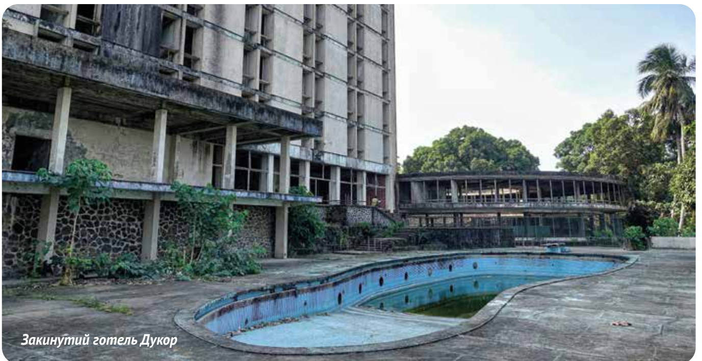
Закинтий готель Дукор