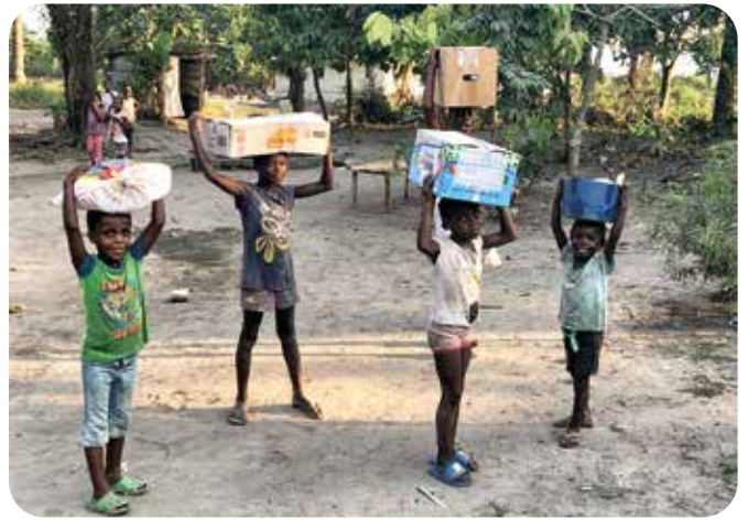
Дитяча праця дуже поширена